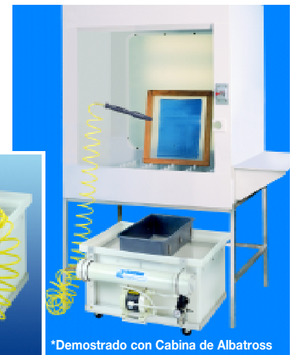
*Demostrado con Cabina de Albatross